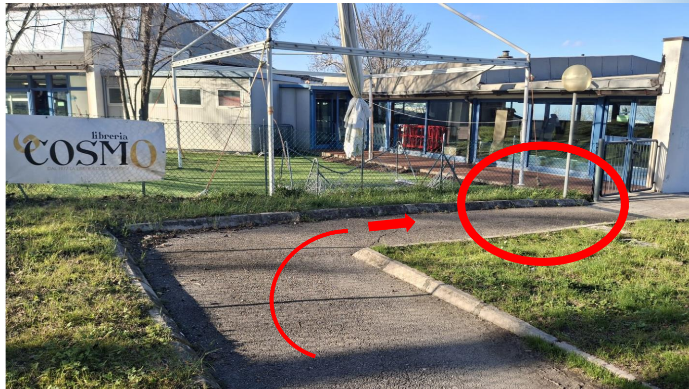
Solo pagamento pasti