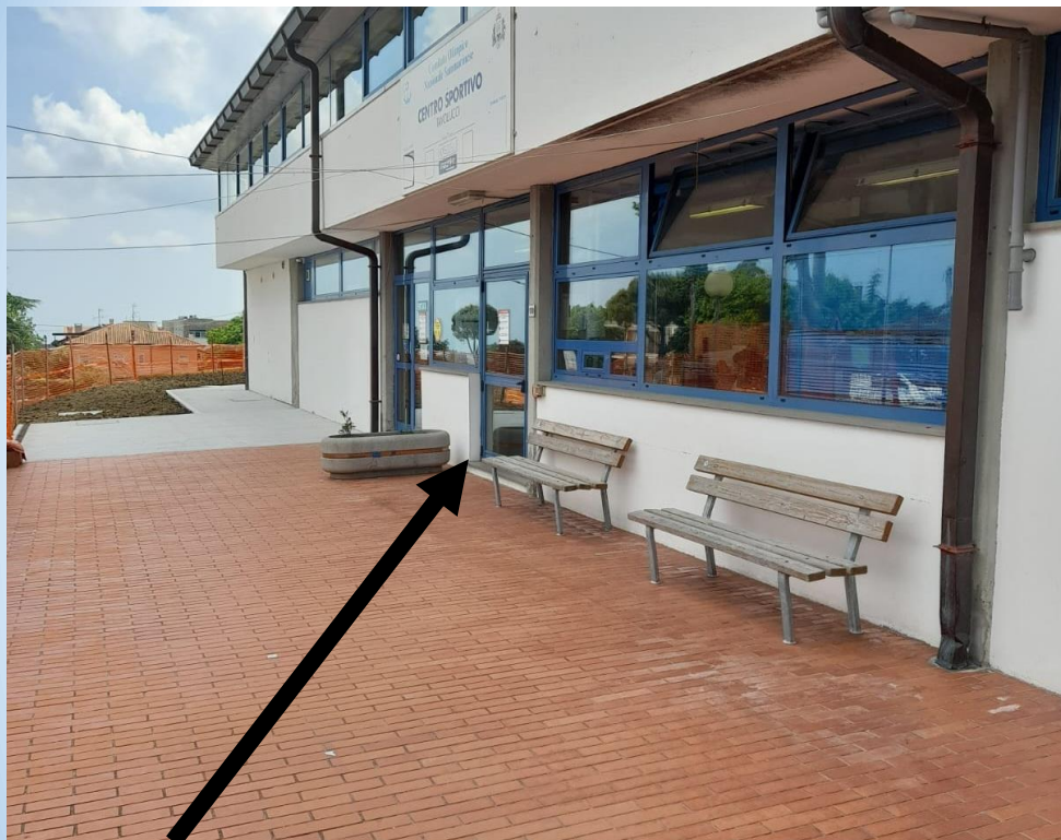
Informazioni, Iscrizioni, Integrazioni, Escursioni, Pasti