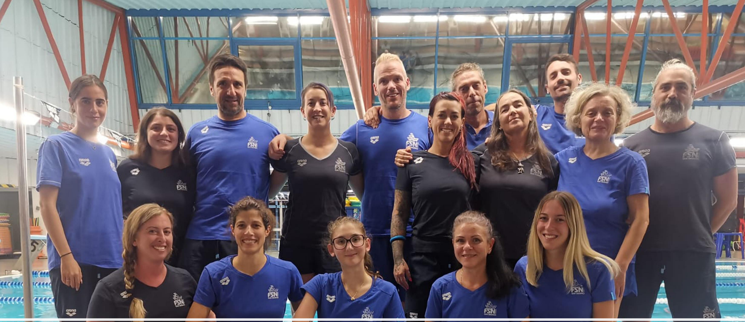
FSN - STAFF